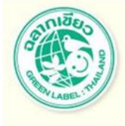
รูปตัวอย่างสินค้า